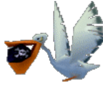
پلیکان بمب انداز